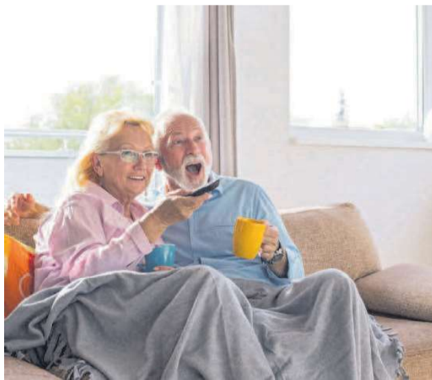
Mit der Fernbedienung lassen sich neue Sender ganz einfach einstellen.

Bitte starten Sie einmalig ab 19. März 2019 (10 Uhr) einen neuen Sendersuchlauf, Ihre simpliTV-Box (oder Ihr simpliTV-Modul) sucht dann automatisch nach