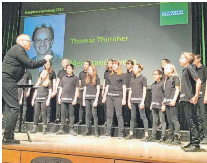
Pizzicanto präsentierte erstmals das Werk „CHOR:sinfonie.“